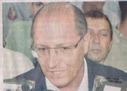
Governador Geraldo Alckmin desembarcou na tarde de ontem em Prudente